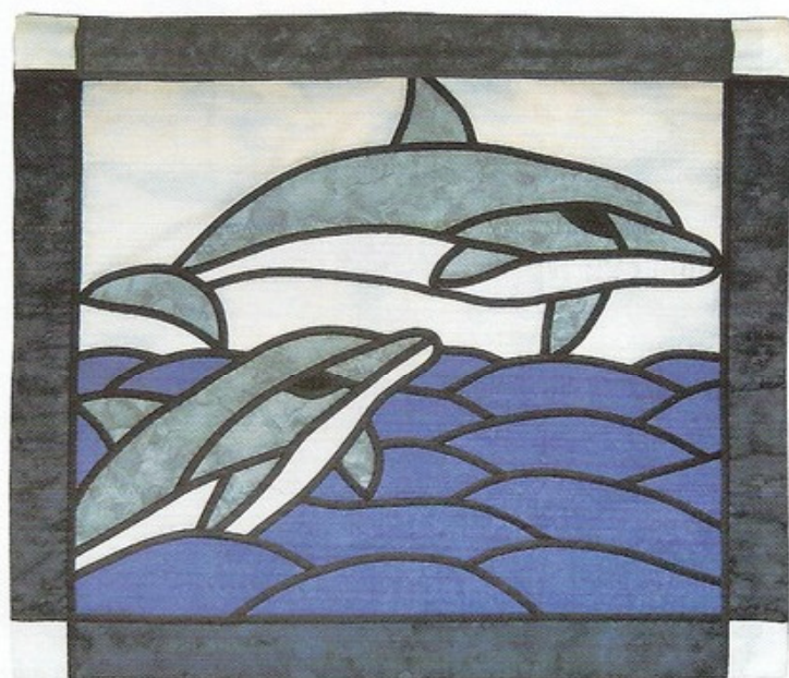
“Delfini” di Rosa Gaudioso