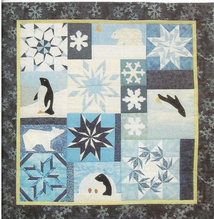
“Inverno” Lavoro di gruppo per il Comune